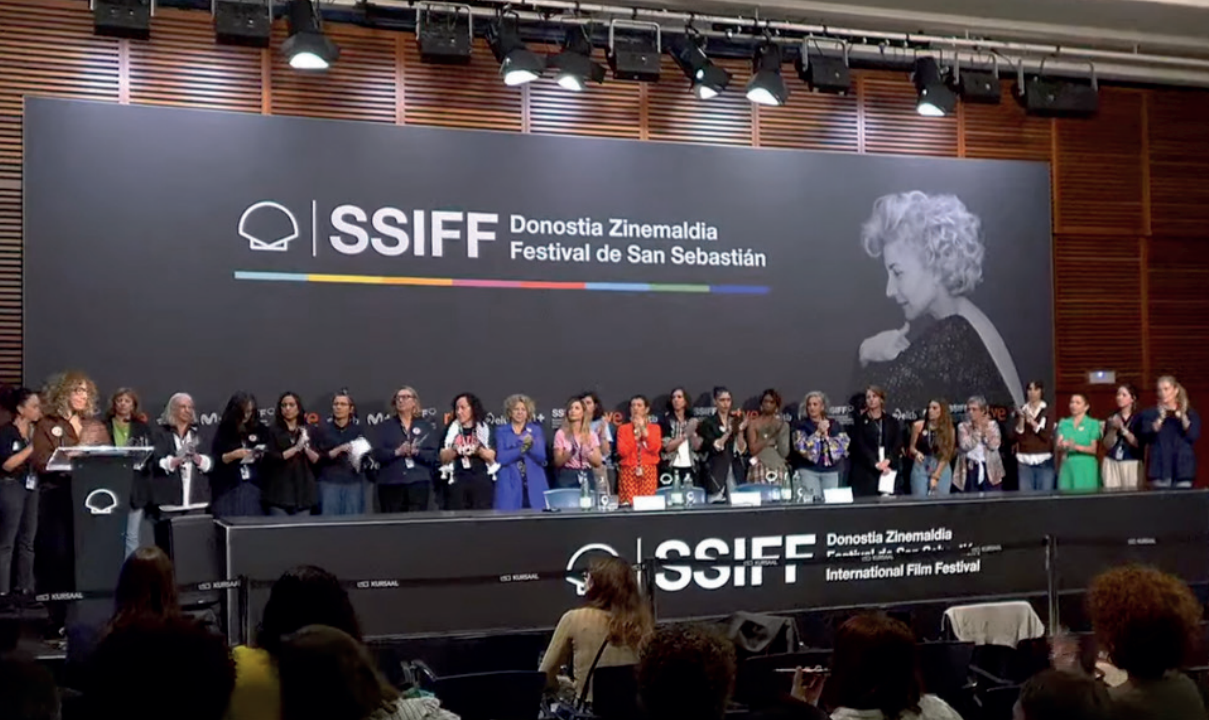
Nuestras voces Argazkia Zinemaldi