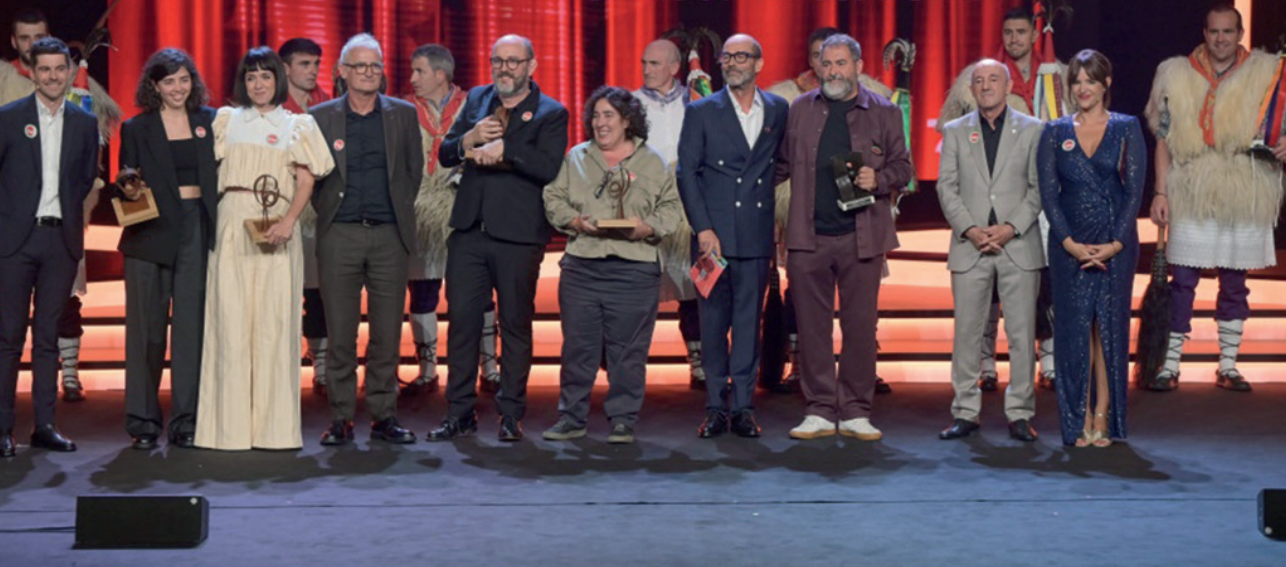
Euskal Zinemaren Galan SSIFF

baina zeregin asko ere badago egiteko. Adibidez, antzokietan publikoa behar dugu. Oraingoa oso adin altukoa da, eta luxuzkoa nola ez, baina gazte jendea hurbiltzearen beharra dago guzti honi jarraipena emateko. Gure kulturari hauspoa ematen jarraitzeko. Hor norberak bere hausnarketa egin beharko du. Zergatik ikuslego falta? Ez dira garai errazak agian sare sozialak eta plataformak direla eta, baina nola ereiten da saretze kultural hori? Momentu honetan diru-laguntza asko oso bideratuta daude proiektu solteen sorkuntzara, baina proiektu horiek batzutan ez dute emanaldi zerrenda bat lortzen erakutsiak izateko. Aldekoak ez diren ze dinamika ari gara gauzaten, non daude giltzak eta non ardura handienak?