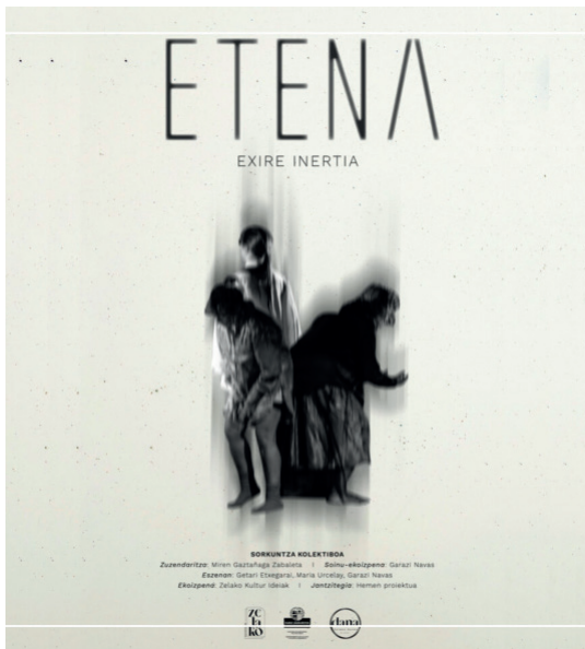
Etena kartela, Stereo liburua Durangoko Azoka